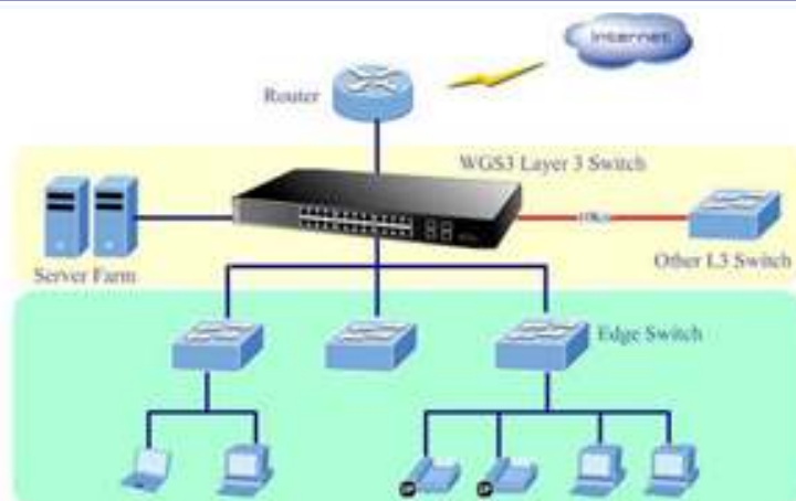
ISP / Telecom Backbone Routing Switch